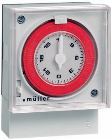
FS 6X.18 (Tagesprogramm)