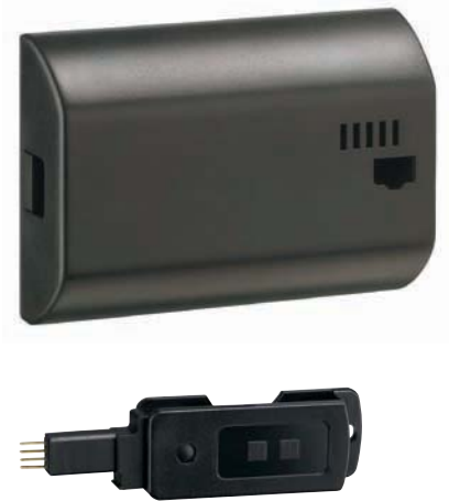
Zubehör: Datenschlüssel Save 'n carry pro